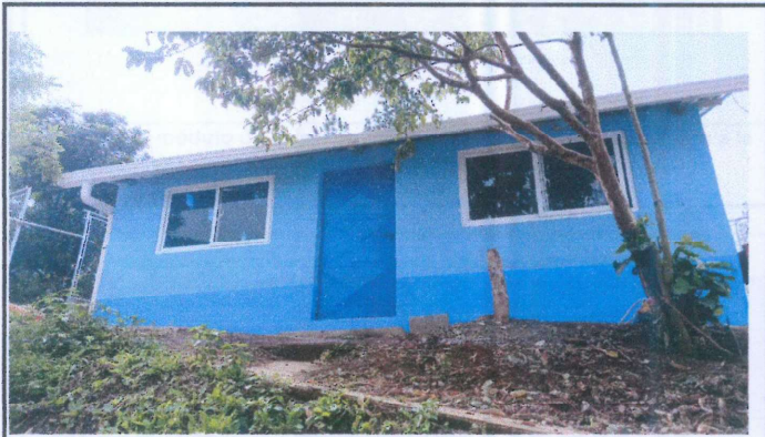
Foto 3: Puerta, ventanas instaladas, y aplicación de pintura exterior e interior finalizadas