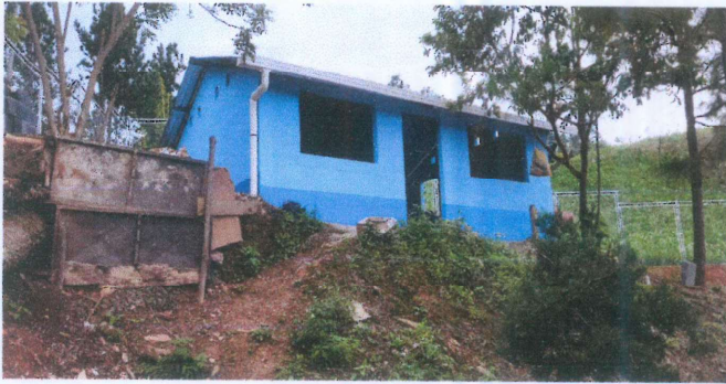
Foto1: Vista lateral de los canales de agua pluvial instalados.