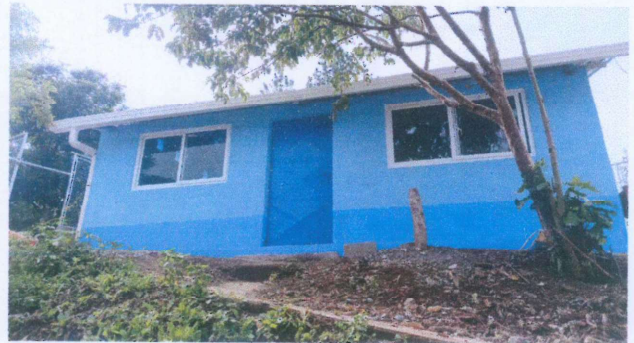
Foto 4: Instalación finalizada de 7.3 metros lineales de canales y bajadas de agua pluvial.

Observación: Si es necesario se pueden agregar hojas adicionales y actualizar el número de hojas.