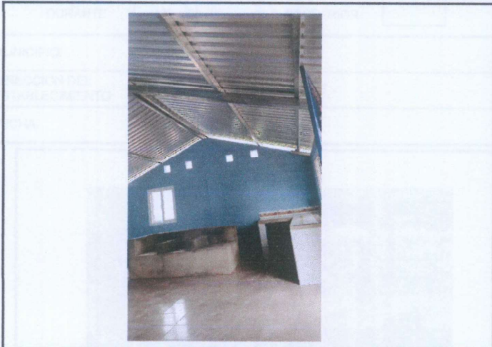
Foto 2: Banco de trabajo, estructura de techo pórtico, lámina troquelada calibre 26 instalada.