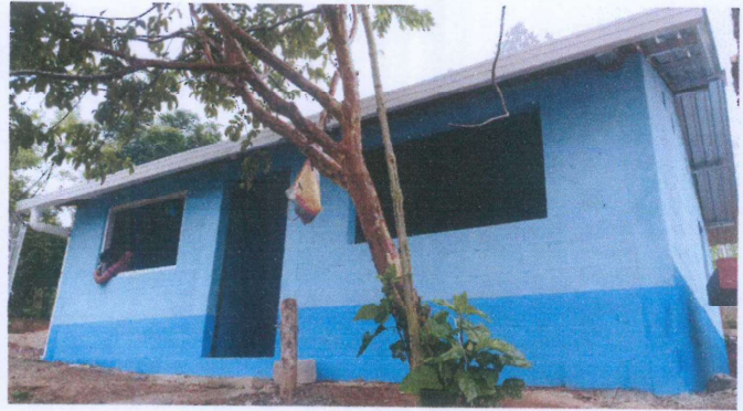
Foto 2: Vista lateral de la instalación de canales y bajadas de agua pluvial del módulo de cocina.