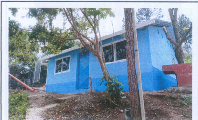
Foto 4: Vista general de la cocina e instalación de puerta metálica.

Observación: Si es necesario se pueden agregar hojas adicionales y actualizar el número de hojas.