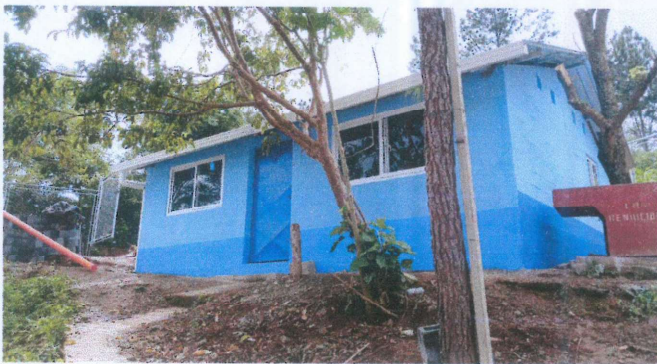
Foto 3: Canales y bajadas de agua pluvial finalizados en el módulo de cocina.