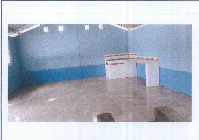
Foto1: Piso cerámico instalado